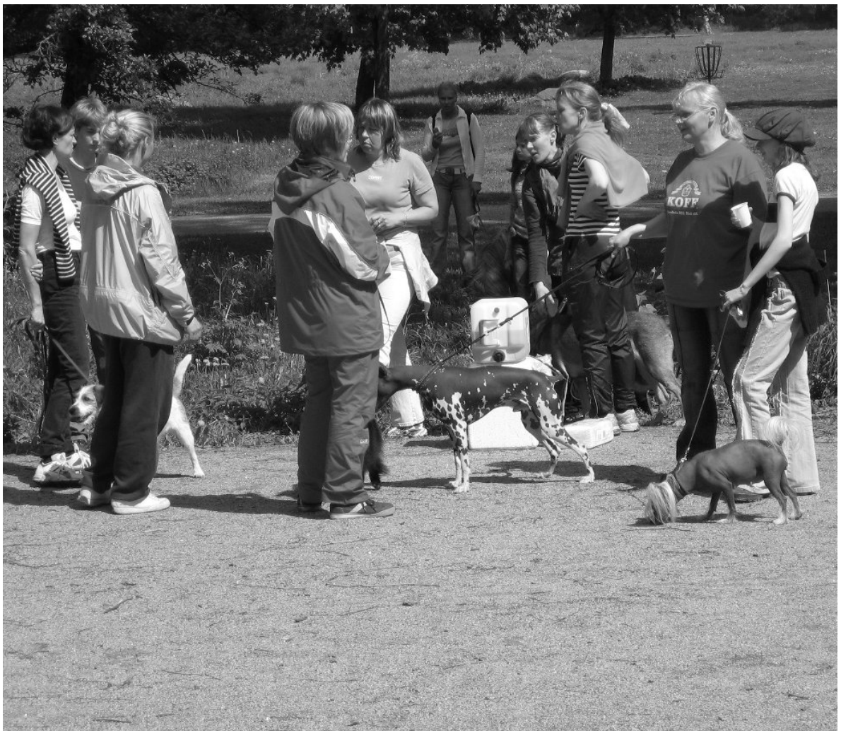
Kuva Munkinseudun koirakerhon toimintapäivästä 5.6.2005

Edellisestä kisakerrasta Camin kanssa on jo vuosia, mutta nyt taisi taas iskeä kisainnostus. Pitää vaan hioa loputkin kuntoon ja eikun uudestaan. ☺